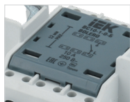
Схема подключения нанесена на корпус механизмов выключателей

Светодиодная подсветка синего свечения гарантирует отсутствие мерцания ламп